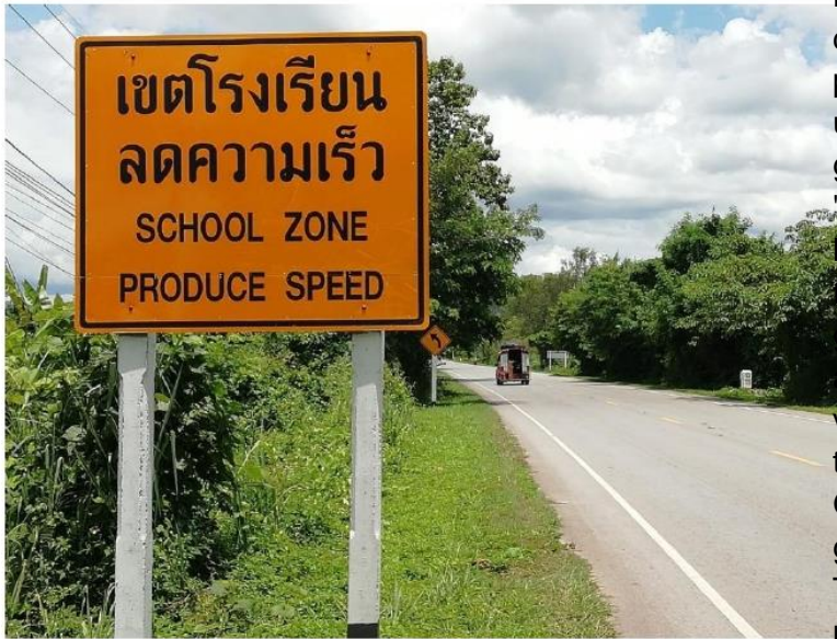
Het oorspronkelijke bord: 'Produce speed'.

kelijk zou worden opgepakt. Of ons signaal inderdaad de aanleiding is geweest van de aanpassing van de tekst is niet zeker. Maar feit is dat inmiddels de tekst is gewijzigd in 'reduce speed'.