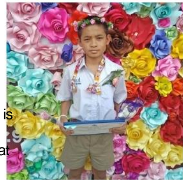
Ole poseert met zijn welverdiende diploma.

het kindertehuis inmiddels de gehele basisschool heeft doorlopen en zich voor de middelbare school kan gaan opmaken.